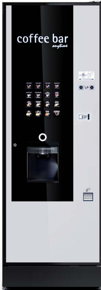
LZ I/E 7

Chaque machine est conçue pour s'adapter à tous les environnements tant en termes de