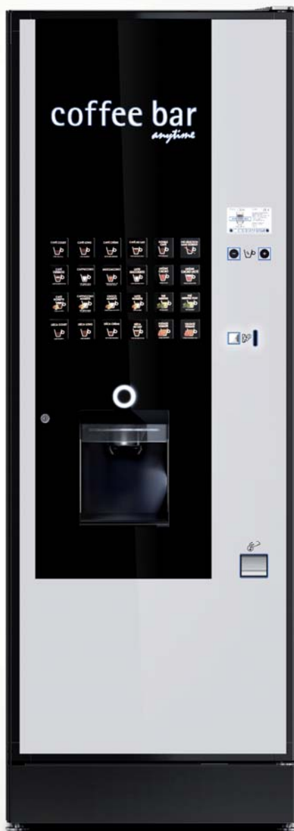
LZ I/E 8

24 sélections clavier capacitif Groupe à café Variflex® Chauffe-eau / Monochaudière 650 gobelets 8 bacs produits