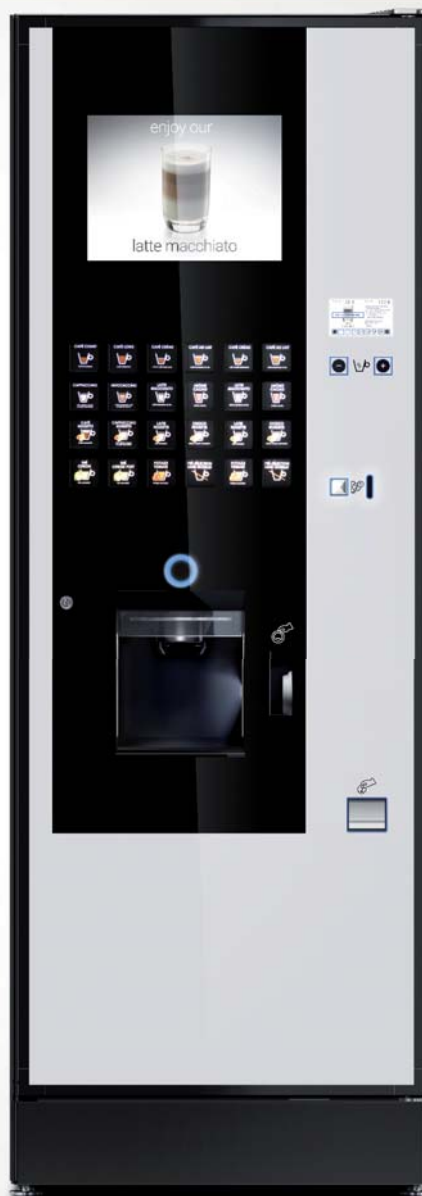
LZ PREMIUM I10 / E 9

24 sélections clavier capacitif Groupe à café Variflex® Chauffe-eau / Monochaudière 650 gobelets 8 bacs produits