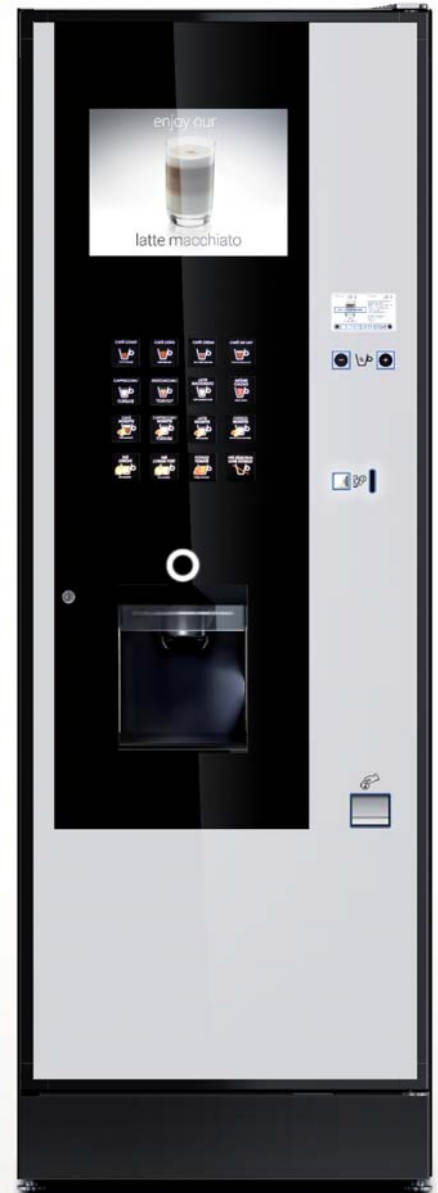
LZ I/E 7 Multimédia

16 sélections clavier capacitif Groupe à café Variflex® Chauffe-eau / Monochaudière 650 gobelets 7 bacs produits