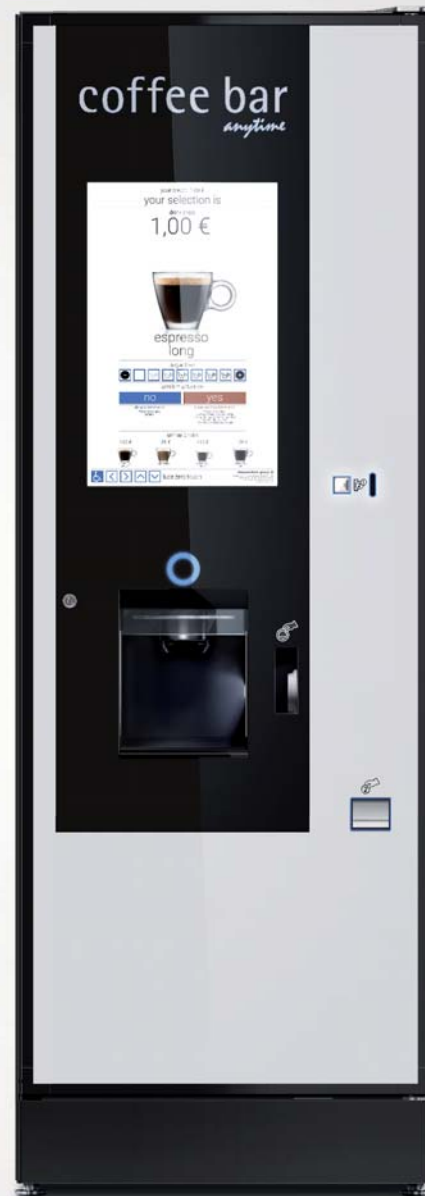
LZ TOUCH I10 / E 9

24 sélections clavier capacitif Groupe à café Variflex® Chauffe à induction Varitherm® Double gobeleteuse 900 gobelets 9 à 10 bacs produits Ecran multimédia 15" HD indépendant du clavier de sélections Distributeur intégré de couvercles «coffee to go»